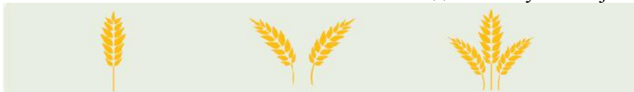
Слика 4. Знак за обележавање сеоских газдинстава у Италији