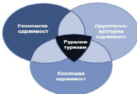
Слика 1. Одрживи рурални туризам