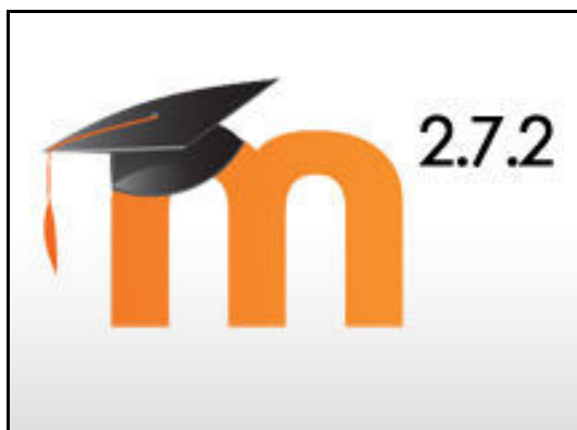
Slika 1. Najnovija verzija Moodle-a 2.7.2

Instalacija i održavanje sistema je u poslednjim verzijama značajno pojednostavljena pa se sve više institucija odlučuje baš za ovu platformu pri izboru okruženja za elektronsko učenje. Dodatne grafičke šeme omogućavaju administratoru da prilagodi izgled, boje, fontove i ostala vizuelna podešavanja lokalnim potrebama i željama, a više od 100 jezičkih paketa dozvoljava potpuno prilagođavanje interfejsa potrebama korisnika koji se služe određenim jezicima. Između ostalih raspoloživa su dva jezička paketa za srpski jezik (ćirilični i latinični). Svaki korisnik ima mogućnost da definiše detalje svoje komunikacije sa sistemom, kao što su: jezik komunikacije, vremenska zona, format datuma i vremena i sl. Jedan Moodle Web sajt može podržavati hiljade kurseva, koji se pak mogu kategorisati i pretraživati. Na raspolaganju je veliki broj mogućih vrsta aktivnosti u okviru kurseva: forumi, testovi, lekcije, zadaci, radionice i dr. Kompletne informacije o aktivnostima polaznika kurseva su na raspolaganju u tekstualnoj i grafičkoj formi.